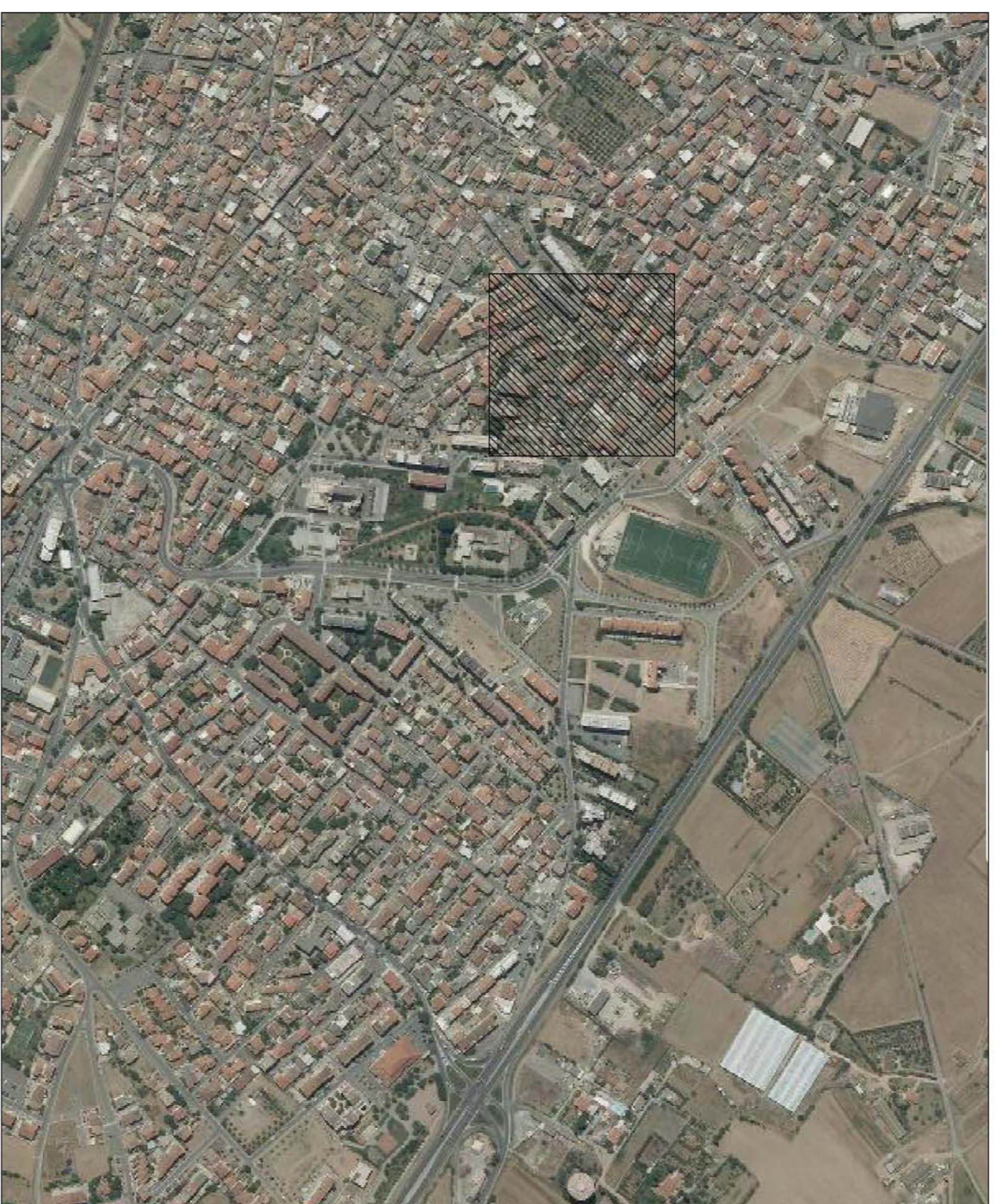
Stralcio Ortofoto scala 1:2000